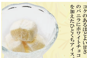
アイス de バニラ