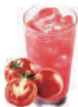
トマトチューハイ