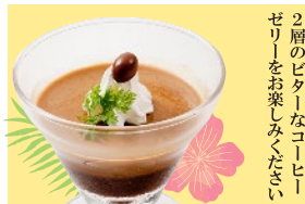
大人のコーヒーズリー