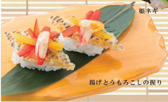
揚げとうもろこしの握り