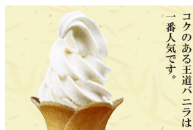
ソフトアイス バニラ