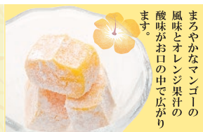
ソルベ de マンゴー