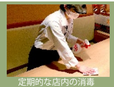
定期的な店内の消毒