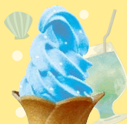
ソフトアイスソーダ (ラムネ系)